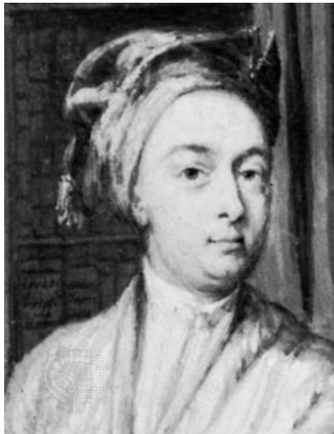
Abbildung 1: Brook Taylor